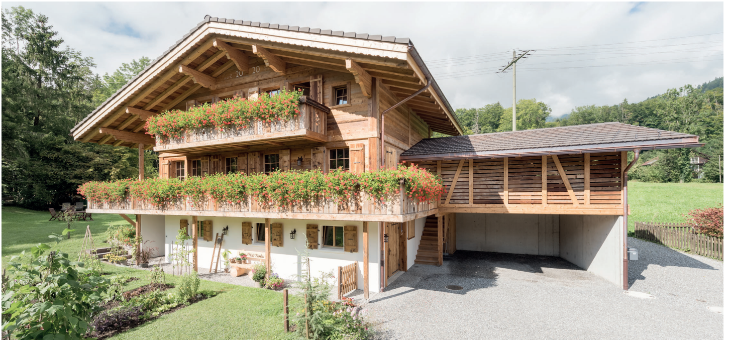
Neues Chalet komplett in Altholz erstellt.