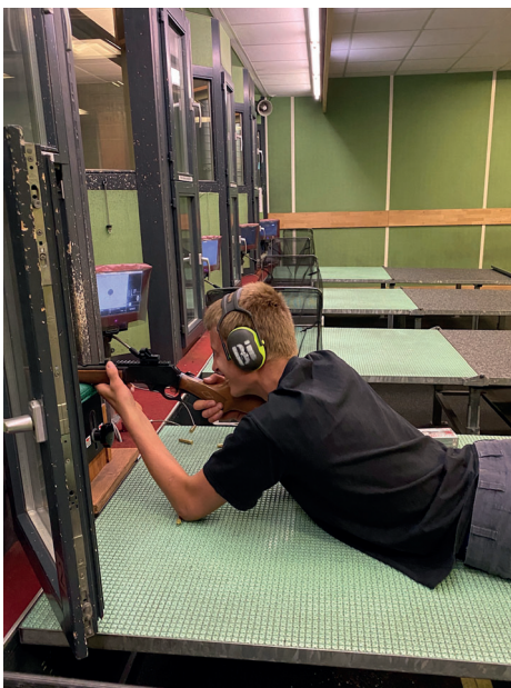
Wer ist der beste Schütze? Dies wurde im Mai herausgefunden im Brünig-Indoor in Lungern.