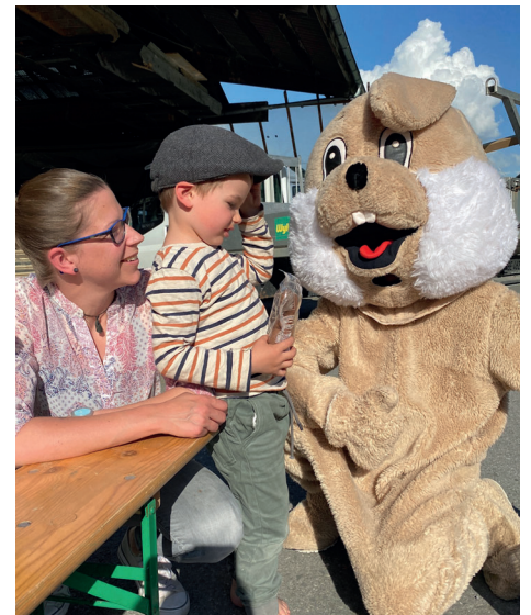
Im April kam der Osterhase zu Besuch und erfreute nicht nur die Kleinsten.