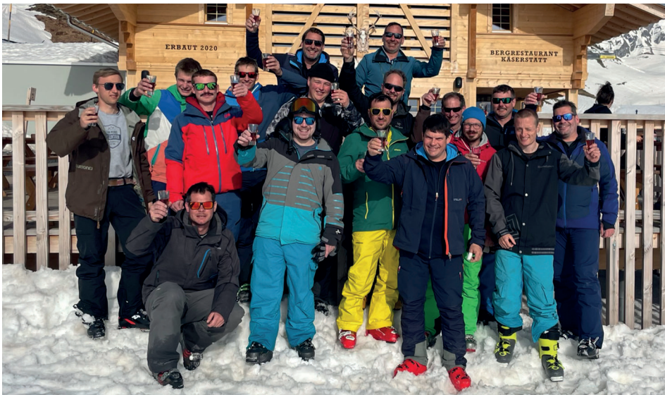
Skiplausch am Hasliberg. Im März vergnügten wir uns zwei Tage auf der Piste, bei schönstem Wetter.