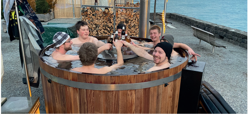
Im Februar ging es lustig zu und her im Hot-Pot Brienz.

Unsere Erfolgsgeschichte verdanken wir auch unseren tollen Mitarbeitern die in den letzten 75 Jahren bei uns angestellt waren oder immer noch sind. Zahlreiche Lehrlinge wurden ebenfalls in unserem Betrieb ausgebildet. Bereits die vordere Generation setzte viel daran, den positiven Teamgeist unter den Mitarbeitern zu halten und organisierte einige gemeinsame Reisen. Auch die heutigen Geschäftsführer möchten vor allem den Mitarbeitern danken und organisieren in diesem besonderen Jubiläumsjahr jeden Monat einen Mitarbeiteranlass. Überzeugen Sie sich selbst von den Bildern das der Teamgeist noch immer funktioniert bei Wyler.