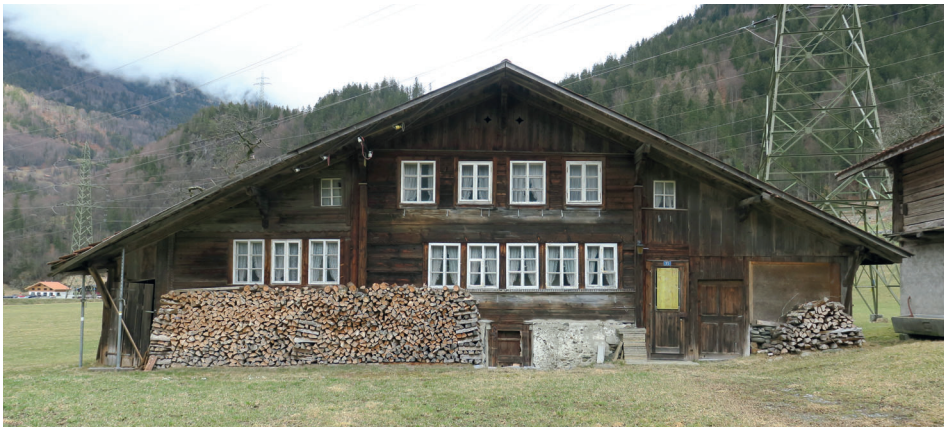
Bestehendes Gebäude bevor es wie oben abgebildet ersetzt wurde.