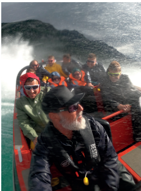
Ein bisschen nass wurde es im Juni beim Jet-Boat fahren.