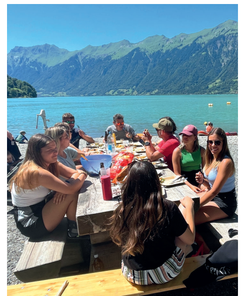
Was gibt es Schöneres im Sommer, als gemütlich mit der ganzen Familie zu grillieren oben am See?